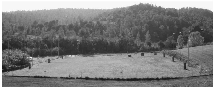
Vista general de las instalaciones, 8.500 m2