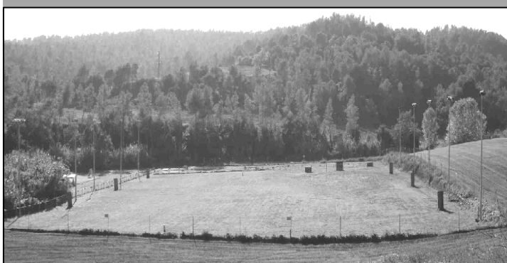
Vista general de las instalaciones, 8.500 m 2