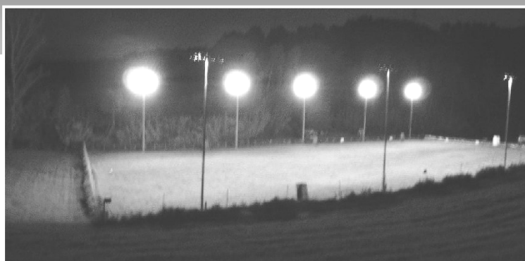
Vista nocturna de las instalaciones 40.000 W