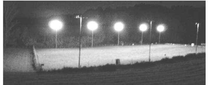
Vista nocturna de las instalaciones (20.000 W)

Con motivo de nuestro 30 aniversario os comunicamos nuestras actividades del 2014: