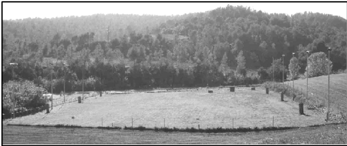
Vista general de las instalaciones, 8.500 m 2

Con motivo de la celebración de nuestro 30 ANIVERSARIO se hará entrega de un RECUERDO ESPECIAL CONMEMORATIVO A TODOS LOS PARTICIPANTES