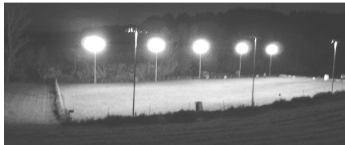
Vista nocturna de las instalaciones 40.000 W

Próximas Actividades 2013-2014: Prueba de Trabajo BH / IPO I-II-III R.S.C.E y R.C.E.P.P.A. 8 y 9 noviembre 2014