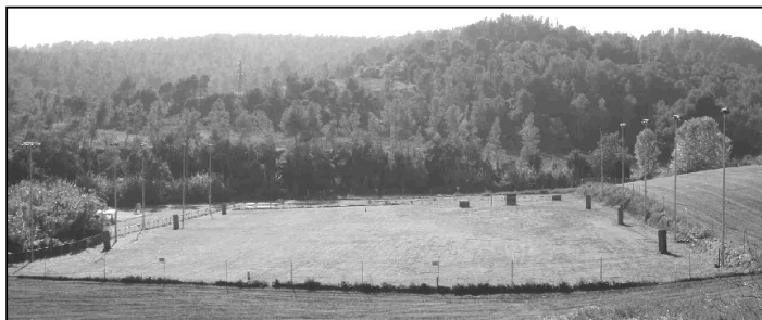
Vista general de las instalaciones, 8.500 m 2

BH: TROFEO GRADOS I, II y III: TROFEO ESPECIAL AL 1º, 2º Y 3º CLASIFICADO y MEJOR SECCIÓN A, B, C.