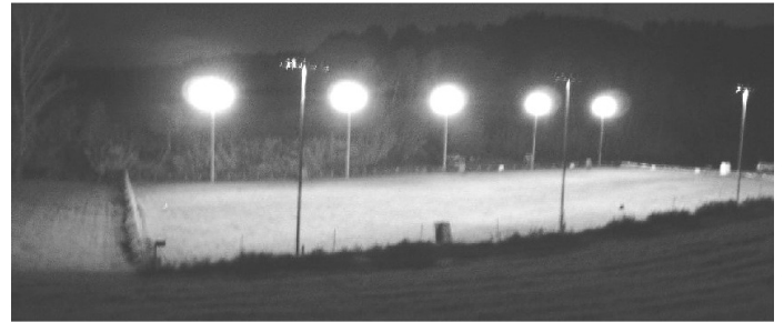
Vista nocturna de las instalaciones 40.000 W

Próximas Actividades 2012-2013: Prueba de Trabajo BH / IPO I-II-II R.S.C.E y R.C.E.P.P.A. 9 y 10 noviembre 2013