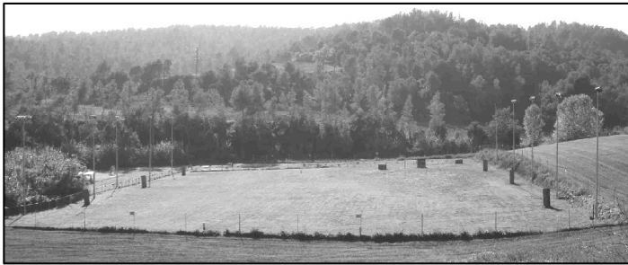
Vista general de las instalaciones, 8.500 m 2

TEST UTILIDAD, BH: TROFEO GRADOS I, II y III: TROFEO ESPECIAL AL 1º, 2º Y 3º CLASIFICADO y MEJOR SECCIÓN A, B, C.