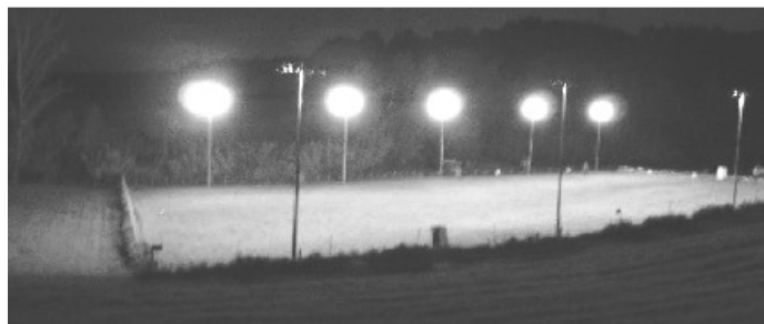
Vista nocturna de las instalaciones 40.000 W

Próximas Actividades 2011-12: Prueba de Trabajo RCI - RCEPPA: 10 y 11 noviembre 2012