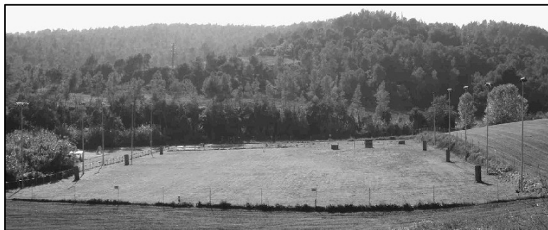
Vista general de las instalaciones, 8.500 m 2